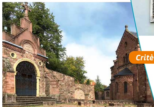
Chapelle et église Saint-Pantaléon

édifiée contre un mur de soutènement entourant l'église. De nombreuses maisons de viticulteurs entourent la place de la mairie et bordent les rues Haute et Basse du village. Plusieurs fontaines anciennes jalonnent le parcours.