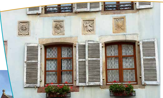
Façade avec des sculptures en pierre