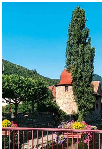
Vue depuis le pont de la Thur

Le peuplier participe au caractère pittoresque de la Tour. Il mesure plus de 15 mètres et a une circonférence de 5,60 mètres. Il forme, avec la tour, et dans le prolongement du clocher de l'église de Thann, un axe de vue de grande qualité qui appartient à la symbolique de Thann. Il est planté le long la "Thur", face aux vignes qui bordent Thann sur son côté Est.