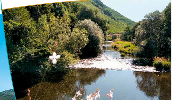
Rivière de la Thur