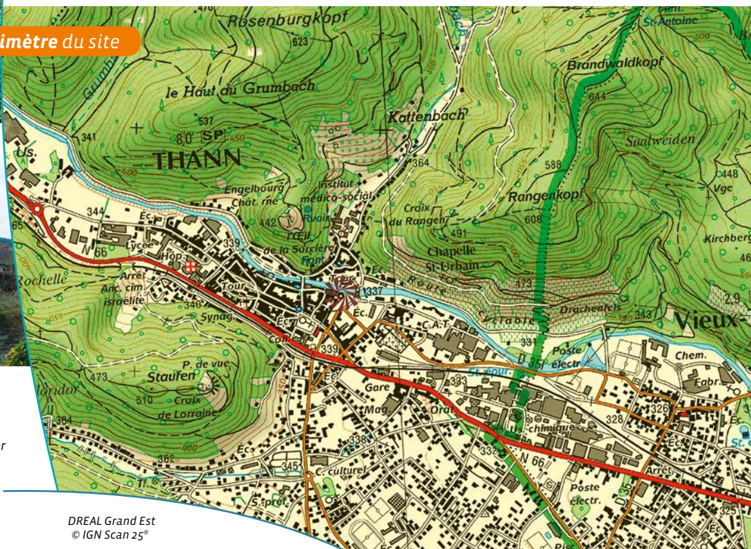
DREAL Grand Est © IGN Scan 25°