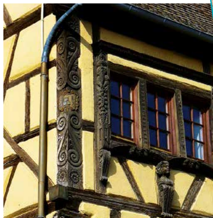
Façade d'une maison à colombages

Au nord-ouest du centre se trouve la Tour des Voleurs, qui servait autrefois de cachots et de salle de torture.