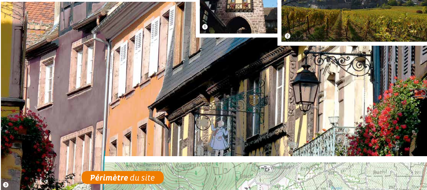
Périmètre du site