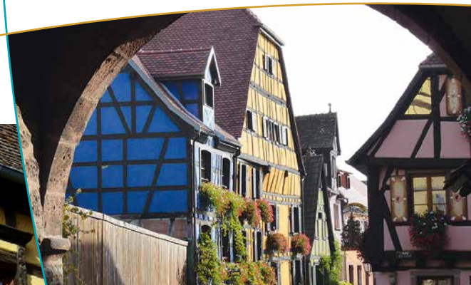
Vue d'une rue depuis le porche