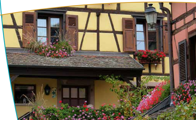
Maison alsacienne fleurie