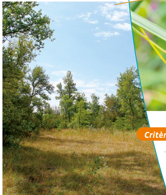
Intérieur de l'île

L'île est issue du creusement du Grand Canal d'Alsace, dont la création a été motivée par la navigation et la production d'électricité. Historiquement, après le Traité de Versailles, la France obtient le droit d'utiliser sur son territoire, et à son profit, les canaux du Rhin entre Lauterbourg et Bâle. L'amorce des travaux date de 1932, avec la déviation des eaux du Rhin sur la centrale hydraulique de Kembs. Bien que le site dans sa forme insulaire soit artificiel, il représente un grand site naturel où se mêlent la richesse des milieux et celle d'une faune et d'une flore extraordinaires.