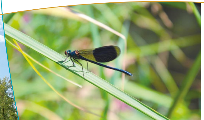
Libellule présente sur le site