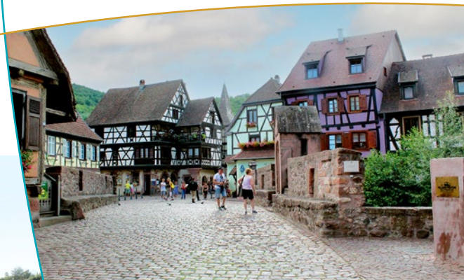
Vue en direction du pont et du centre urbain