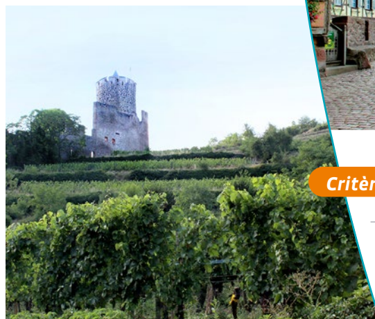
Le château du Schlossberg

L'ensemble urbain historique est également protégé. Les racines latines du nom de l'agglomération pourraient signifier « place forte » et « passage », qui correspond à cette situation urbaine.