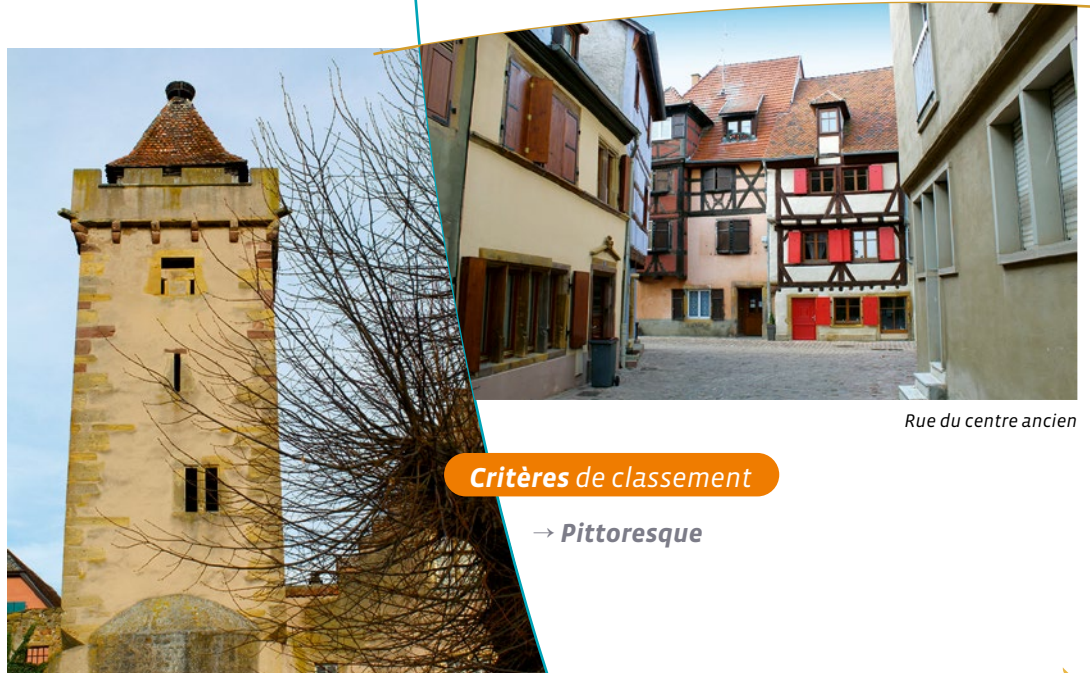
Rue du centre ancien

Cette localité comprend une église en grès jaune mêlant styles roman et gothique. Une des deux tours est inachevée. La façade comporte une magnifique rosace à vingt lancettes. La nef est en style gothique du XIII ème siècle. Et le château d'Isenbourg qui fut habité par le roi Dagobert II et son fils Sigebert. Aujourd'hui c'est un hôtel de luxe. La ville est au V ème siècle une résidence des rois mérovingiens d'Austrasie qui construisent le château d'Isenbourg. Au VII ème siècle, la ville connaît un miracle : le futur évêque de Strasbourg, Arbogast, ressuscite le fils du roi Dagobert II, qui offre, reconnaissant, la ville au prince-évêque de Strasbourg. La ville connaît un fort développement qui permet la construction d'une enceinte.