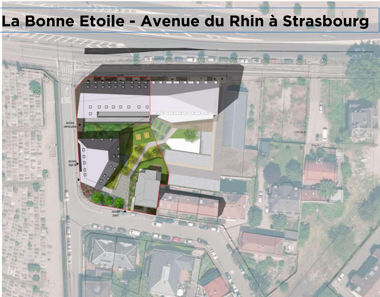
Plan de masse 1/500

Maison Intergénérationnelle ouverte depuis août 2020