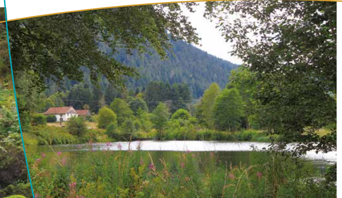
Vue sur le fond de vallée