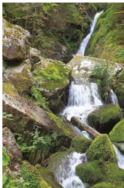
Chute de la cascade

La cascade formée par les eaux du ruisseau du Rudlin se précipitent d'une hauteur de 30m à travers d'énormes rochers, pour tomber dans un petit bassin creusé par ses eaux. L'endroit a conservé son intégrité, son « naturel » dans le paysage pittoresque de la combe du Valtin. C'est un lieu de quiétude. On trouve ici, comme on se le représentait encore à la fin du XIX ème siècle, l'image romantique de la cascade jaillissante dans le clair-obscur des sous-bois. Le lieu a conservé l'essentiel de son caractère.