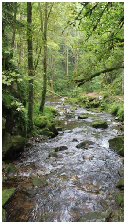
Le Bouchot en aval de la cascade

Serpantant au cœur de la vallée de Rochesson, le petit ruisseau du Bouchot se précipite en trois rebonds dans un chaos de rochers de granite, formant le "Saut du Bouchot". Entre les sapins, les eaux tombent écumantes d'une hauteur de 28 m dans un bassin rocheux avant d'aller rejoindre paisiblement les eaux plus calmes de la Moselotte. C'est un endroit remarquable, bucolique et sauvage.