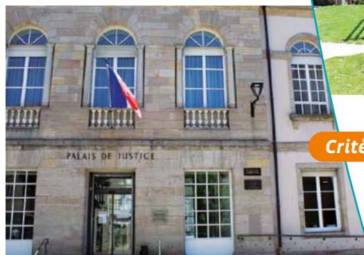
Le palais de justice