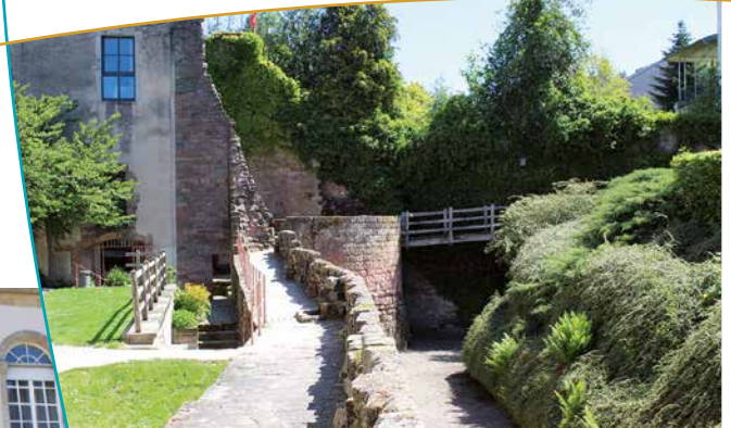
Vestiges des anciennes murailles