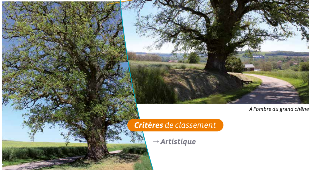
À l'ombre du grand chêne

Il s'agit d'un arbre remarquable, solidement campé sur une colline qui domine Bainville-aux-Saules. Son âge est difficile à estimer. Il est probablement plusieurs fois centenaire. En 1913, il mesurait déjà 4m50 de circonférence, 15 mètres de hauteur totale et 2m50 de hauteur de fût. Il semble qu'il ait résisté aux intempéries : sa forme et son état de végétation ne laissent pas à désirer.