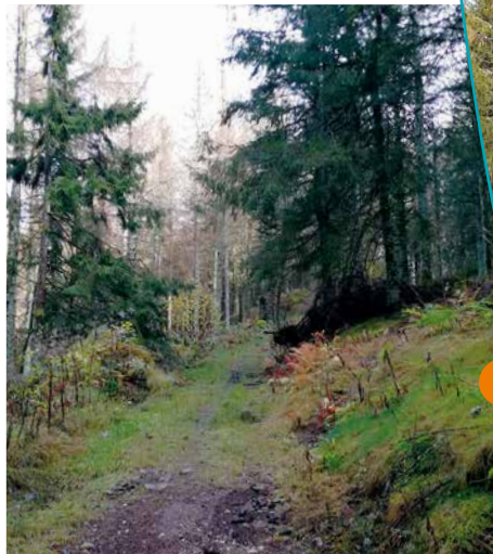
Sentier menant au Haut du Roc

Ce site rocheux repose sur un socle de granit couronné par un immense plateau de grès vosgien, bouleversé et crevassé. Le plateau de grès est en outre parsemé d'un grand nombre de blocs erratiques transportés par les anciens glaciers. De pareils phénomènes sont assez fréquents dans ces montagnes, témoins de la glaciation. A noter que le Haut du Roc est le point le plus élevé où l'on trouve le grès vosgien.