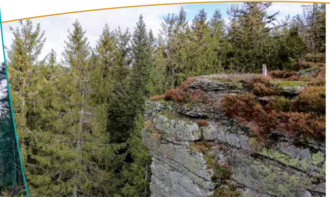
Le Haut du Roc