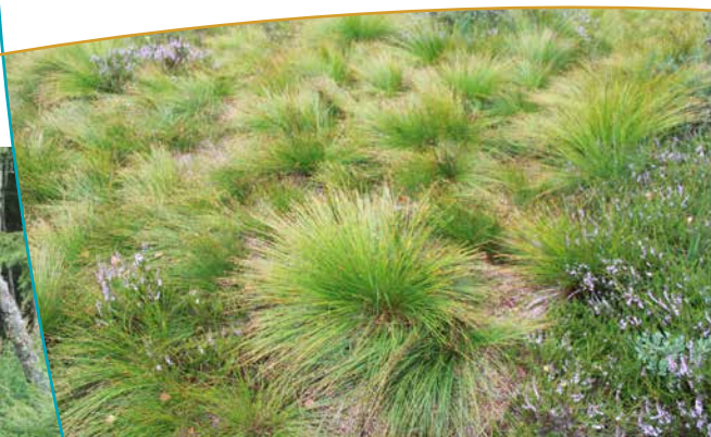
Végétation de la tourbière (Molinie)