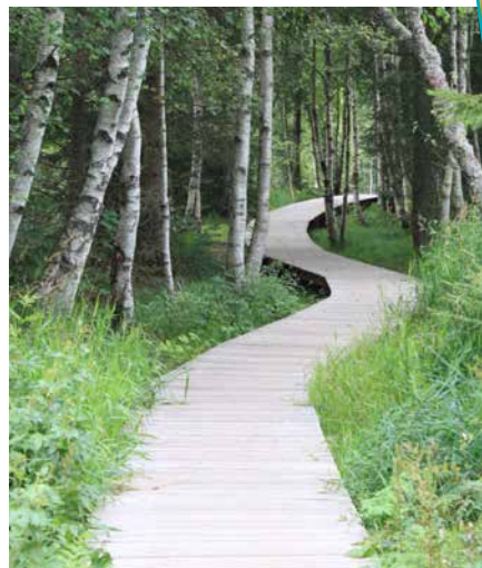
Aménagement piétonnier aux abords de la tourbière

d'assèchement très progressif au bénéfice de la tourbière. Cette évolution est amorcée depuis la fin des périodes glaciaires qui ont donné aux Vosges la dernière touche de leur modelé actuel.