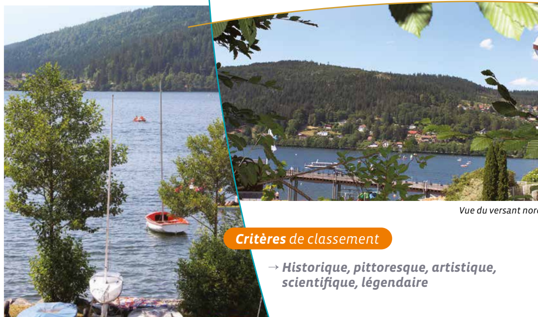
Vue du versant nord

Situé à 660m d'altitude, il s'est formé à l'arrière d'une moraine de l'ancien glacier du Hohneck. Ses eaux proviennent de la Vologne. Ecrin naturel au sein du Parc Naturel des Ballons des Vosges, ce lac devient un attrait touristique majeur au début du XX ème siècle, ses rives portent encore de très belles villas, témoins de cette période. Aujourd'hui encore ce lac est le théâtre de nombreuses manifestations telles que la fête des Jonquilles et le festival du film fantastique et reste une destination touristique prisée, la « Perle des Vosges ».