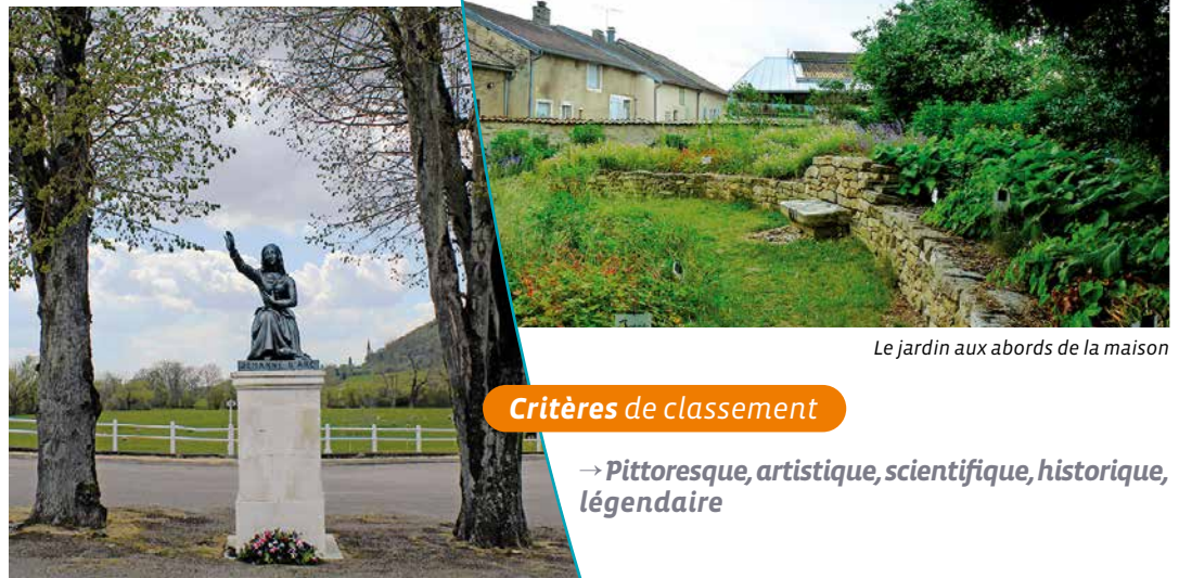
Le jardin aux abords de la maison

à l'extrémité du pont édifié au XVIII ème siècle, l'ensemble regroupait divers éléments : de vieilles maisons, la maison natale de Jeanne d'Arc, l'église Saint-Rémy. La maison natale date du XV ème siècle et a été fortement modifiée à partir du XVIII ème siècle. De nouveaux équipements et aménagements destinés à l'accueil du public ont vu le jour dans cet ensemble, comprenant aujourd'hui un musée dédié à Jeanne d'Arc.