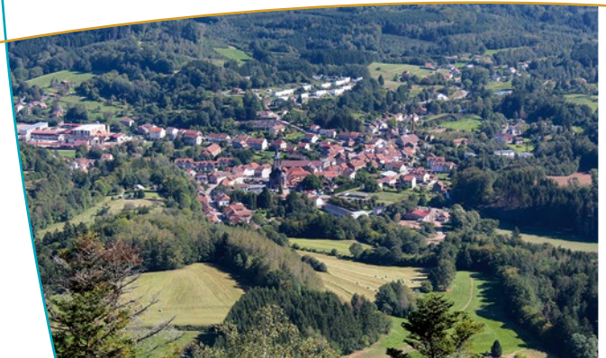
La petite Raon depuis la Roche