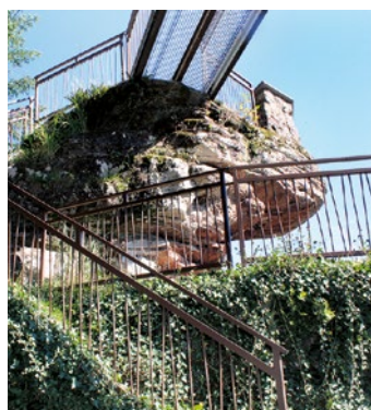
Escalier menant au sommet de la roche

C'est sur cette barre rocheuse qu'un sentier de mémoire exceptionnel a vu le jour et permet d'appréhender aujourd'hui encore cet endroit magnifique qui a aussi servi d'observatoire durant la première guerre mondiale.