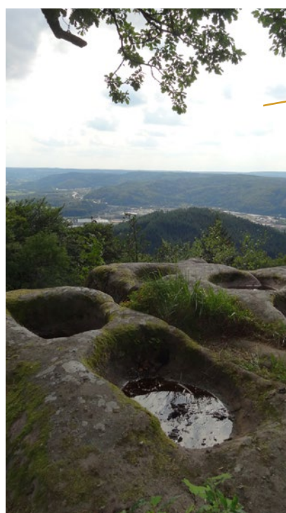
Les cuveaux et la vallée de la Moselle

Ces cavités témoigneraient de la présence d'anciens glaciers : les eaux provenant de ruisseaux coulant à la surface de ces glaciers auraient produit ces érosions en tombant plus ou moins verticalement, comme dans un puits, jusqu'à la roche sous-jacente. Quelques archéologues ont cru découvrir dans ces bassins des monuments du culte celtique : les trous auraient alors été creusés par des druides pour y placer les victimes lors de sacrifices.