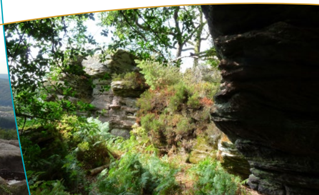
Formations rocheuses aux abords du belvédère