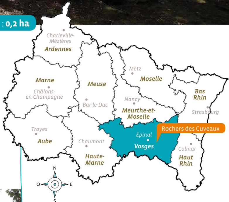
Rochers des Cuveaux