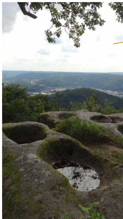
Les cuveaux et la vallée de la Moselle

Ces cavités témoigneraient de la présence d'anciens glaciers : les eaux provenant de ruisseaux coulant à la surface de ces glaciers auraient produit ces érosions en tombant plus ou moins verticalement, comme dans un puits, jusqu'à la roche sous-jacente. Quelques archéologues ont cru découvrir dans ces bassins des monuments du culte celtique : les trous auraient alors été creusés par des druides pour y placer les victimes lors de sacrifices.