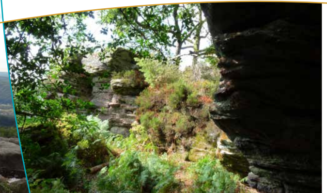
Formations rocheuses aux abords du belvédère