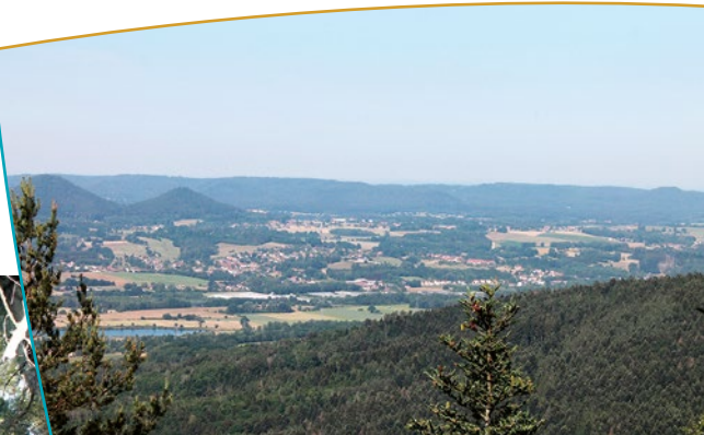
Vue sur la vallée de la Meurthe depuis les Roches