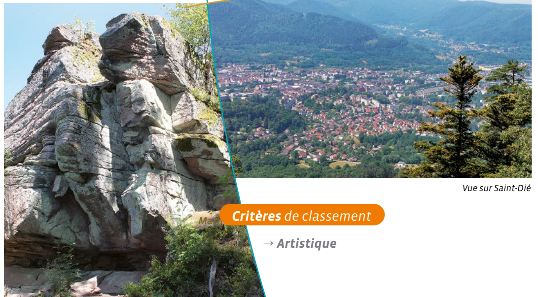
Vue sur Saint-Dié

La légende nous apprend que les fées voulurent construire ici un pont gigantesque au-dessus de la vallée de Sainte-Marie pour rejoindre le massif du Taennchel. Elles commencèrent donc le travail en empilant les blocs qui forment actuellement les "Roches des Fées". Mais elles n'étaient pas pressées et le travail traîna. Jusqu'au jour où les premiers missionnaires chrétiens arrivèrent en Alsace, chassant les fées.