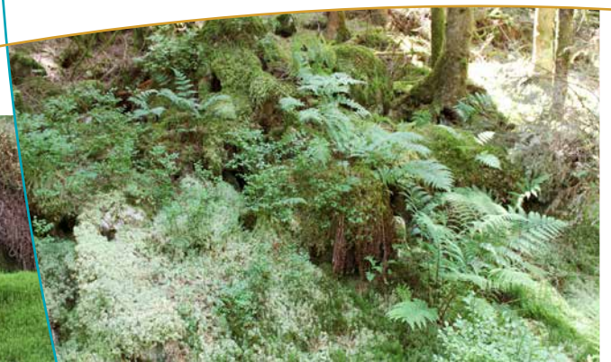
Tapis de sphaignes et de fougères