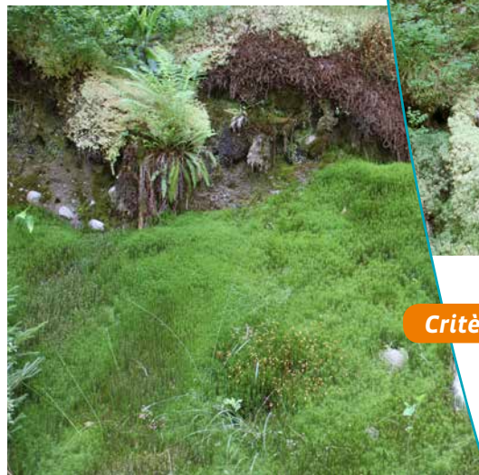
Tapis de sphaignes et de fougères

le cadre qui l'entoure, constitue un véritable anachronisme au milieu du paysage actuel.