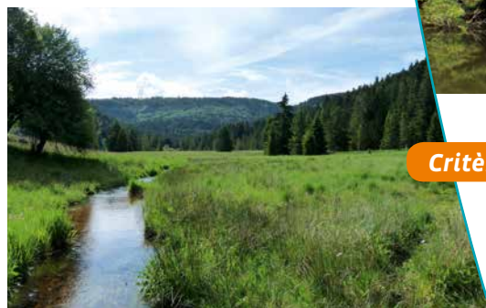
Le ruisseau de Belbriette

est mentionnée sur une carte du XV ème siècle. Cette occupation agraire ancienne et l'ouverture des espaces qu'elle a générée dans le fond de la cuvette et surtout sur les bas versants ont largement contribué à l'enrichissement des points de vue et du paysage du site.