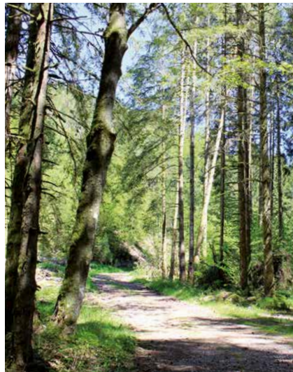
Sentier menant au trou de l'enfer

La gorge "Le Trou de l'Enfer" fait partie de ces sites romantiques et chargés de légendes, qui renforcent leur attrait et leur charme.