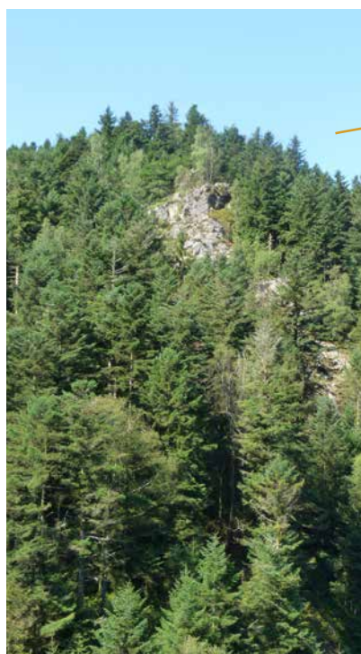
Vue sur les roches depuis le fond de vallée

C'est un lieu exceptionnel pour la pratique de nombreuses activités très variées, notamment le tourisme vert et culturel, ou encore les sports de plein air.