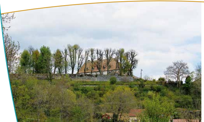
Le château de Neuves-Maisons à Harchéchamp

insertion, quasi intacte dans son environnement naturel, d'un patrimoine bâti. Seules quelques réalisations ont introduit un élément étranger dans une composition parfaitement groupée. Le caractère compact de cet assemblage est issu, dans ce cas, de la fortification qui l'enserrait. Une « tour » fut vraisemblablement érigée à Autigny au XII ème siècle, récupérée par la famille du Châtelet. Beaucoup de détails architecturaux attestent de l'ancienneté du village. Des constructions rehaussent l'ensemble : les deux moulins qui ponctuent les rives du Vair, le pont qui commande l'entrée du village, le château du XVIII ème siècle.