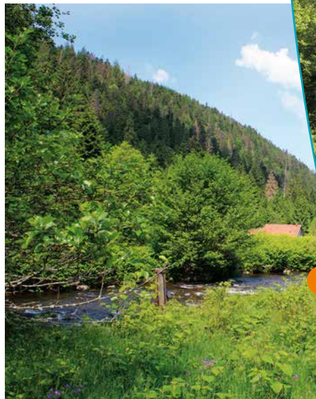
La vallée de la Vologne

La Vologne est un affluent de la Moselle. La partie située sur la commune de Granges-sur-Vologne (environ 4,5 km) bénéficie d'une protection. Cette vallée est flanquée de deux versants abrupts, s'élevant de 250 à 300 mètres et couverts, de la base au sommet, de sapins séculaires, d'énormes rochers ou d'éboulis. La Vologne coule au pied, à travers des arbres croissant naturellement et des rochers sombres qui, partout, tapissent sa couche. La rivière, la ligne de chemin de fer et la route occupent le fond de la vallée, dont la largeur, en certains endroits, ne dépasse pas 20 ou 25 mètres ; les versants sont si rapprochés qu'ils laissent à peine le temps au soleil de l'éclairer.