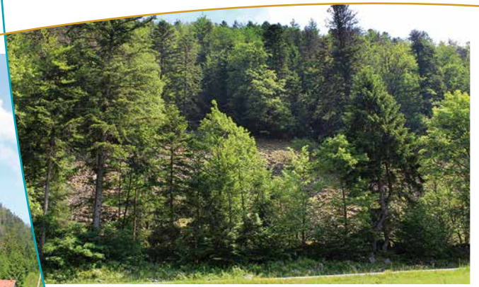
Le versant couvert par les éboulis et les résineux au sommet