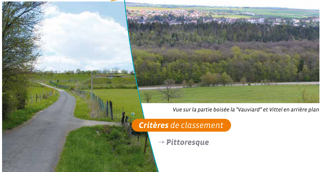
Vue sur la partie boisée la "Vauviard" et Vittel en arrière plan

Le Mont Saint-Jean et la colline de Norroy dominant la ville et présentent leurs écrans de verdure du plus heureux effet. De même, la station, avec son établissement thermal, sa galerie de cure, ses hôtels, bénéficie d'une situation privilégiée puisque les vastes étendues du parc thermal, de l'hippodrome et du golf ne constituent qu'un ensemble avec les forêts et la campagne environnante qui sont agrémentées de nombreuses promenades et pistes cavalières fréquentées.