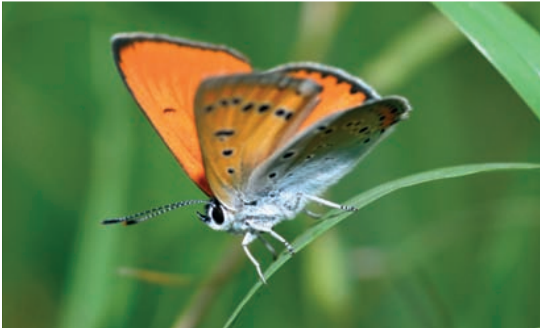
1-2-3 Cuivré des marais 4 Prairies naturelles à Rumex sp.