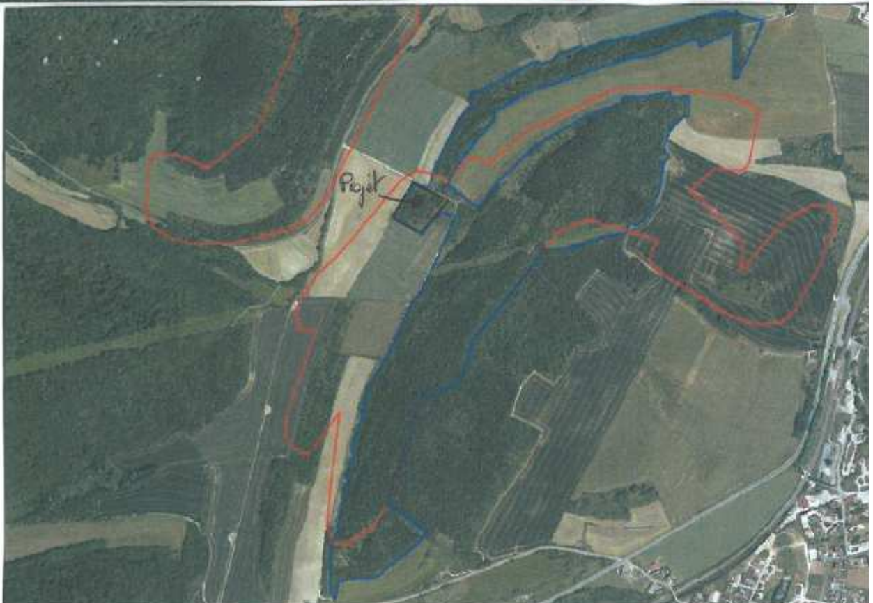
Illustration 2: en Rouge: périmètre du site Natura 2000, en bleu: périmètre de la ZNIEFF de type 1