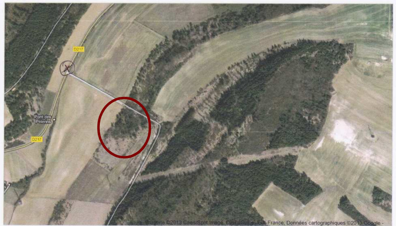
Illustration 1: Localisation de la prise de vue et site du projet