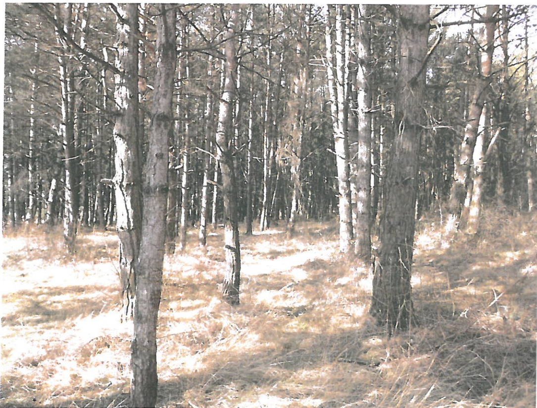
Vue interne de la plantation