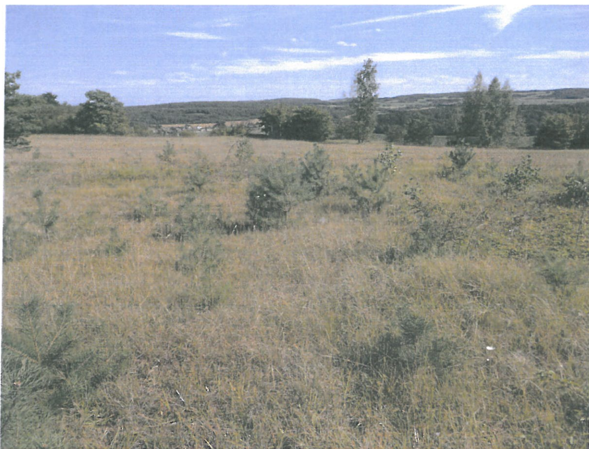
Jeunes pins envahissants la pelouse calcicole de grand intérêt écologique au Sud