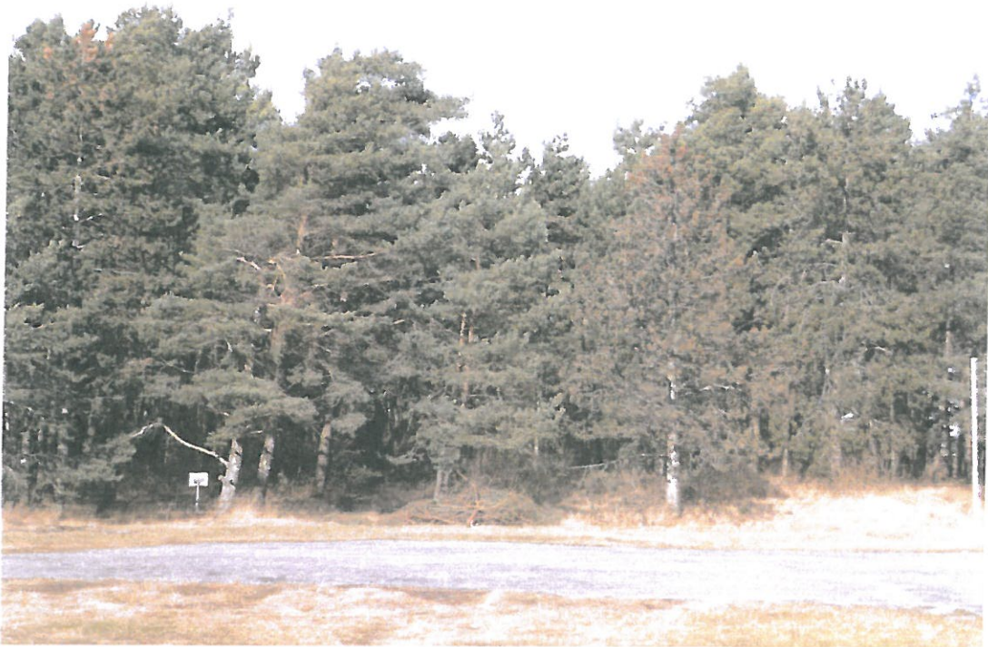
Vue de ma pinède depuis le Sud