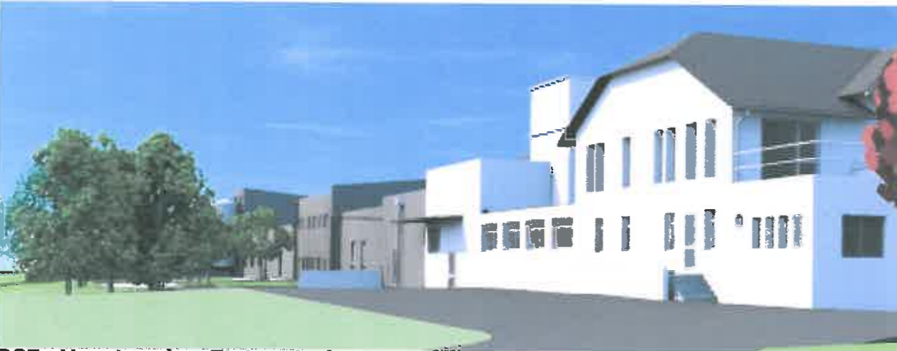
PC7 - Vue de près - Etat projeté