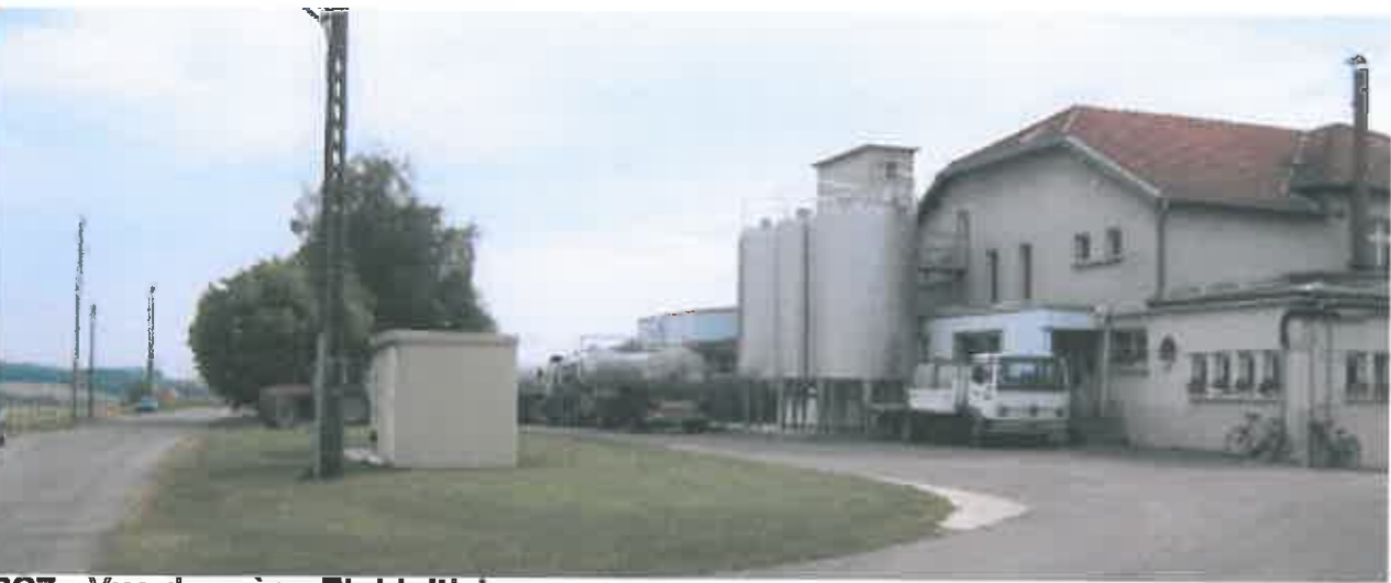
PC7 - Vue de près - Etat initial