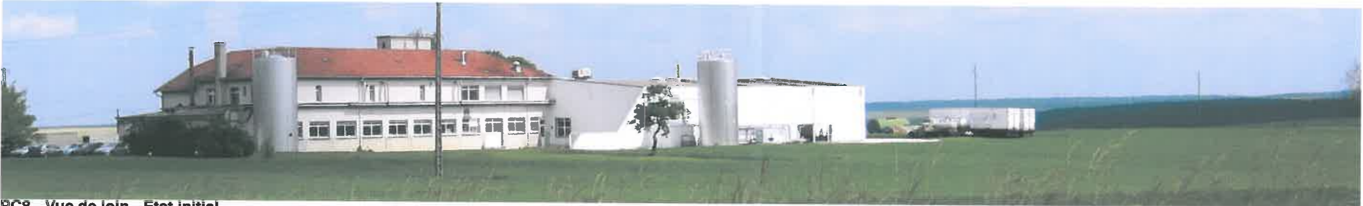
PC8 - Vue de loin - Etat initial