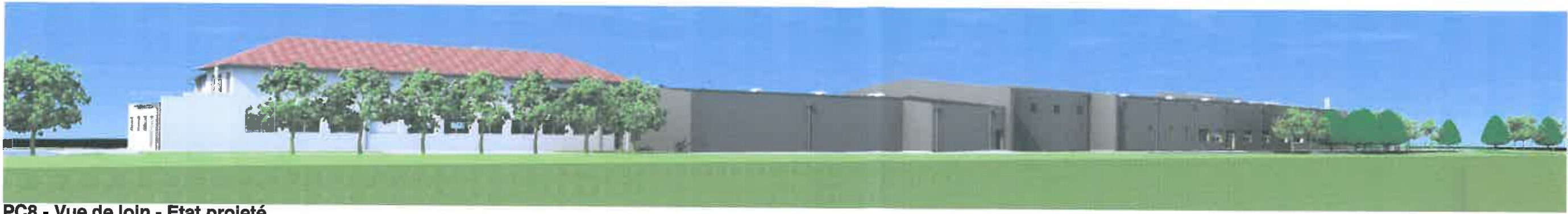
PC8 - Vue de loin - Etat projeté