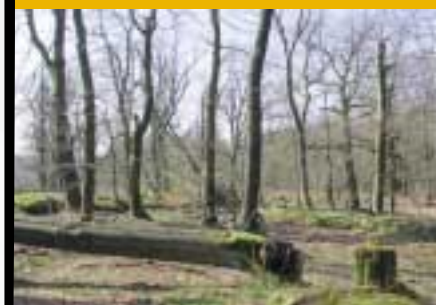
La larve de Lucane Cerf-Volant se développe dans les arbres morts

Le Lucane Cerf-Volant est étroitement lié aux arbres feuillus, principalement au chêne. Il se rencontre aussi bien en milieu forestier que dans les zones ouvertes présentant des arbres isolés ou des haies. Les adultes vivent sur les branches et le tronc de vieux arbres (des chênes préférentiellement). Les larves se développent dans le système racinaire de souches ou d'arbres morts. Les taillis et les haies en milieu ouvert sont également favorables au Lucane.