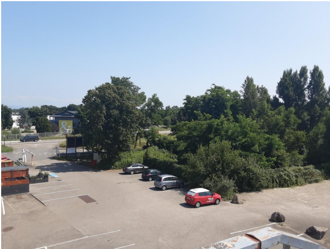
Photo 1 a) (07/2021) Vue depuis passerelle SNCF vers le l'Est, Futur entrée et parking du PEM