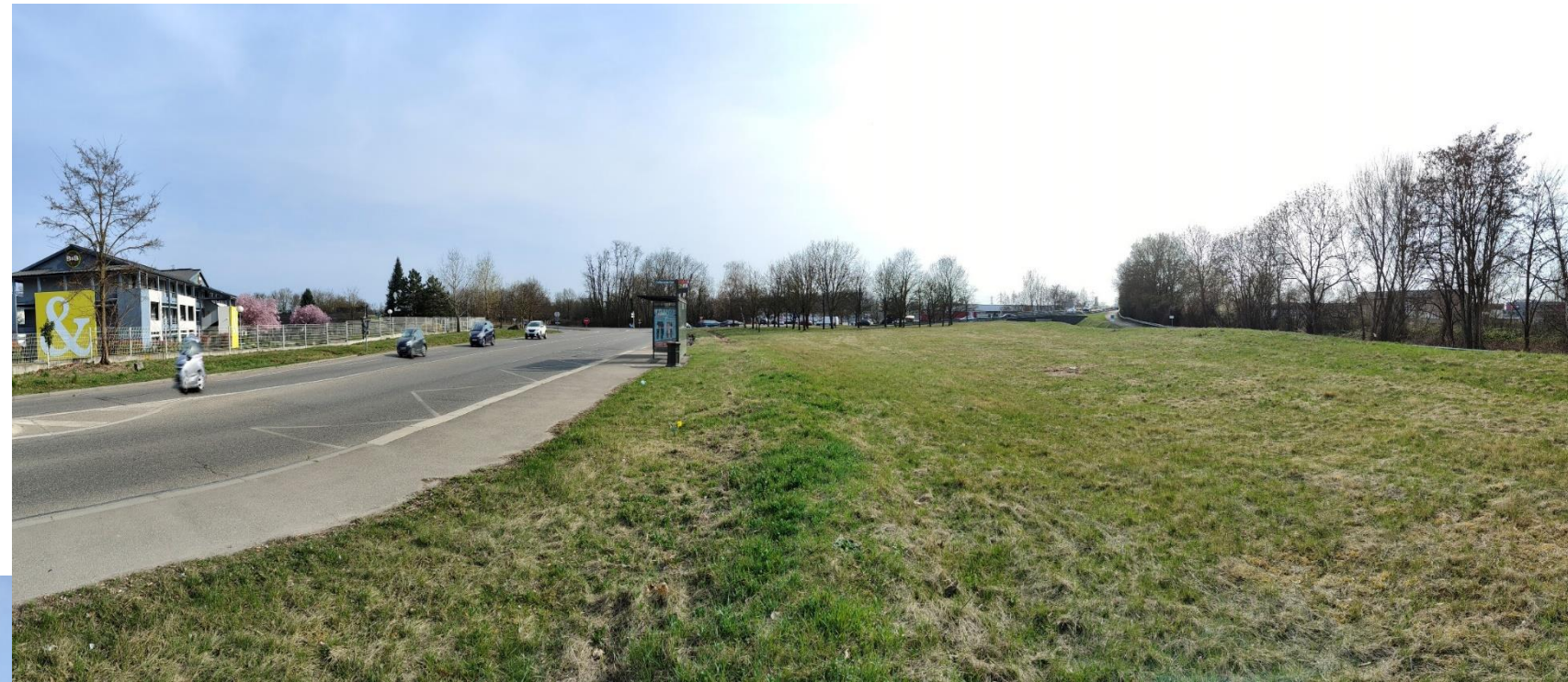
Photo 2 (03/2021) Vue depuis la rue du 23 Novembre vers le giratoire