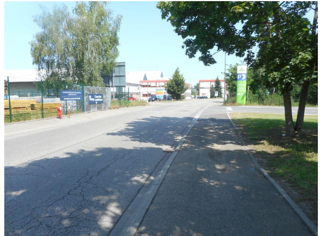
Photo 6 (07/2021) Vue vers Leroy Merlin depuis la rue Alfred Kastler