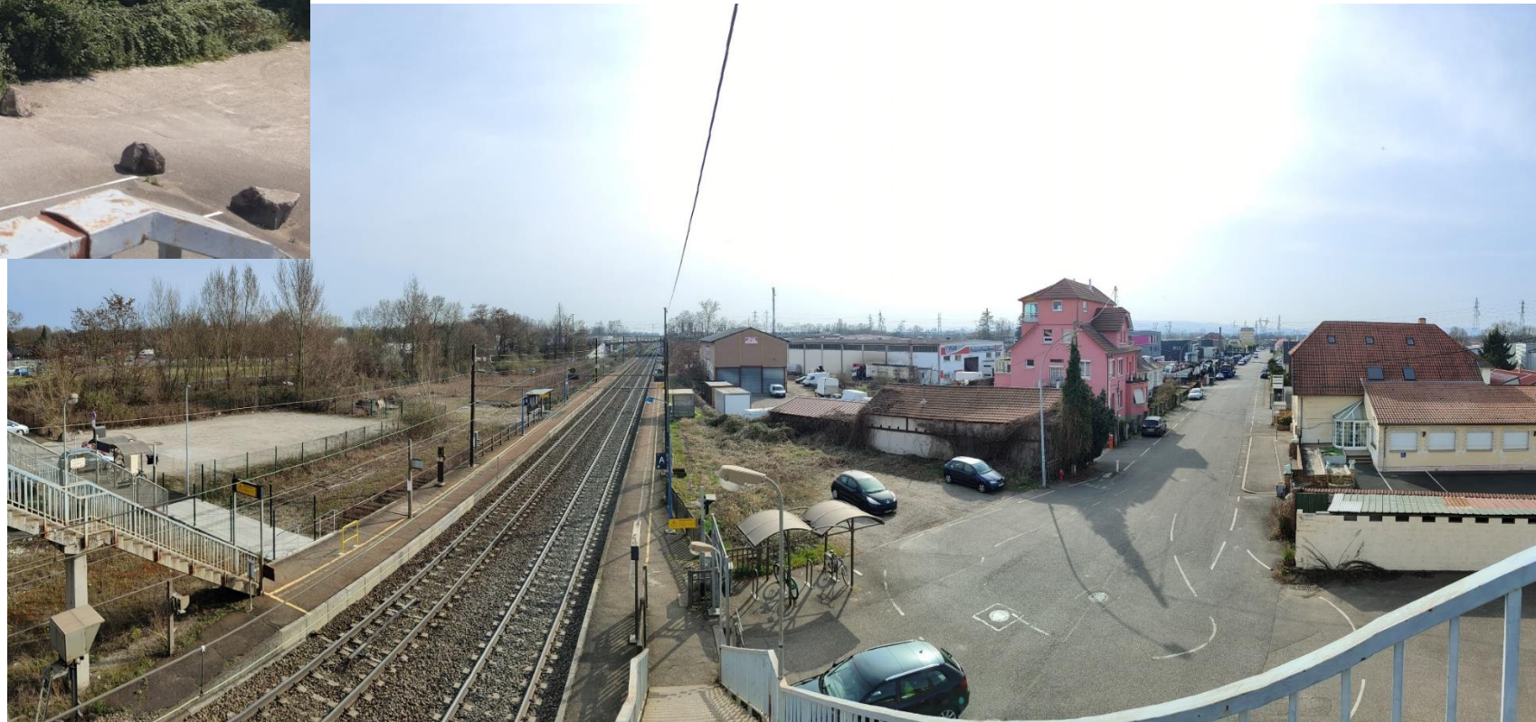
Photo 1 b) (03/2021) Vue depuis passerelle SNCF vers le sud, futurs parkings du PEM à l'Est et l'Ouest