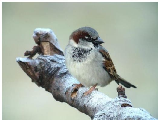
Le moineau domestique

Les couples nicheurs utilisent principalement les bouches d'aération en façade dans lesquelles les grilles sont manquantes et/ou détériorées.