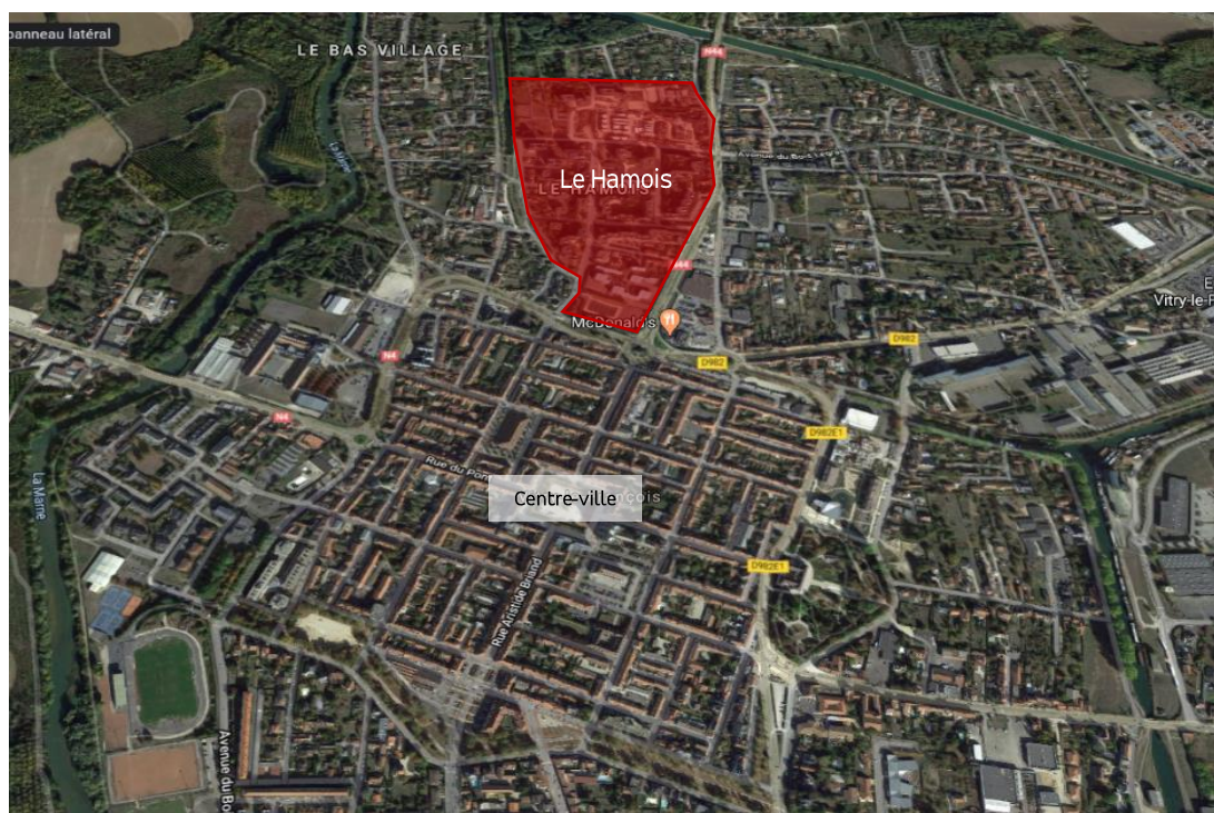
Localisation du quartier du Hamois

La ville entre alors dans une phase de décroissance : En 1975, la commune comptait 19 372 habitants, en 1990, 17 033 et aujourd'hui 12 552 (source : Insee). Cette perte de population a induit une vacance sur l'ensemble du territoire vitryat. A l'heure actuelle, le quartier du Hamois est touché par une forte vacance (vacance structurelle supérieure à 40 %), notamment sur le secteur Nord fragilisé, qui pâtit d'une mauvaise image et, par conséquent est moins attractif.