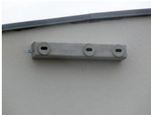
Exemple de nichoir pour martinets noirs

De ce fait, la LPO préconise l'installation de 2 sites de reproduction sur le quartier. Cela correspond à 1 nid de plus que le nombre de nid identifié sur les bâtiments de la quatrième phase de démolition.