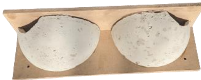
Nids artificiels pour hirondelles de fenêtre

Cela correspond à 1 nid de plus que le nombre de nid identifié sur les bâtiments de la quatrième phase de démolition.