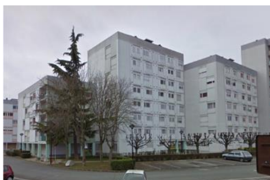
Les Serins (à gauche), Les Bouvreuils (au centre), Les Geais (à droite)

Le dossier d'intention de démolir (DID) a été envoyé le 29 mars 2021 pour instruction auprès des services de l'Etat. Ceux-ci ont donné leur accord le 31 mai 2022 dans le cadre de la prise en considération du dossier d'intention de démolir (PCDID).