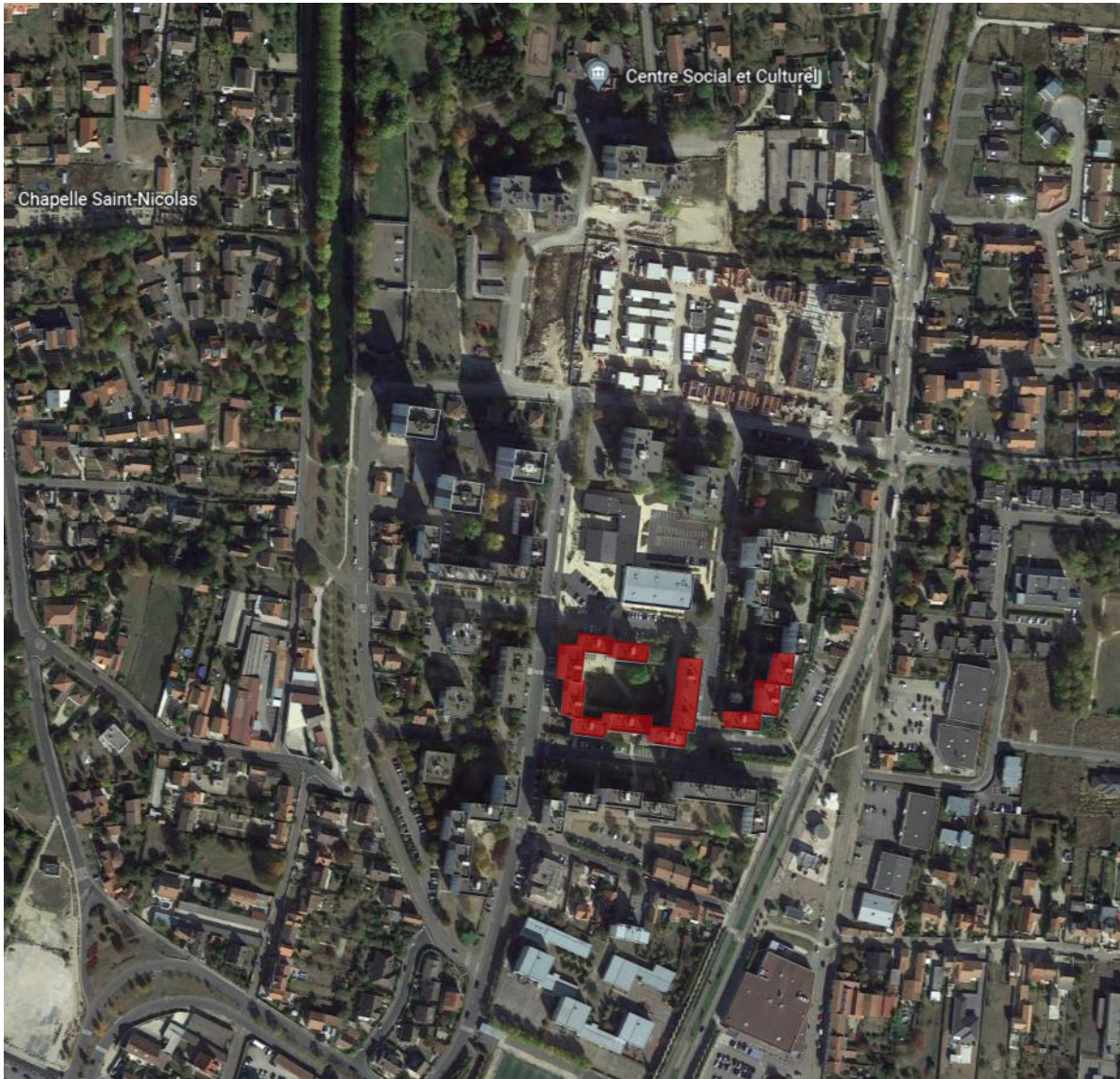
Localisation des immeubles concernés par le dossier de demande de dérogation

Les immeubles concernés par les diagnostics du Conservatoire d'espaces naturels de Champagne-Ardenne (CENCA) et de la Ligue de protection des oiseaux (LPO) sont situés au Centre-est du quartier du Hamois.