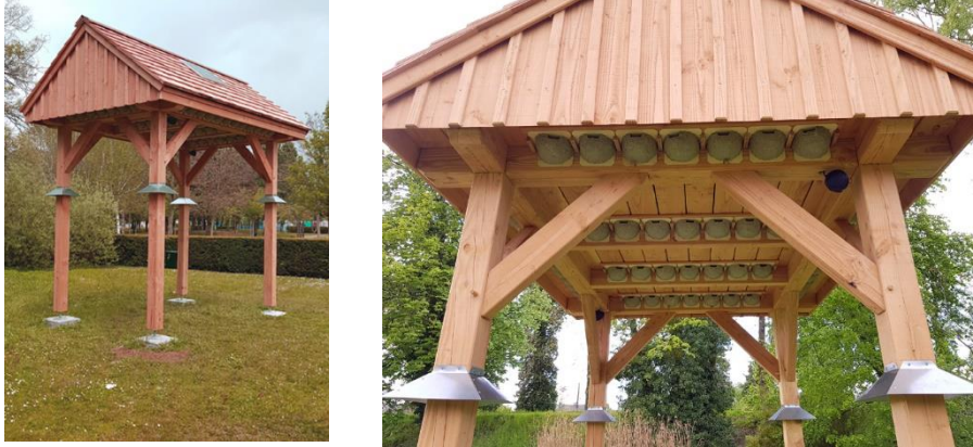
Le préau à hirondelles installés au printemps 2021 dans le cadre des mesures compensatoires suite à la démolition de trois immeubles

Pour rappel, dans le cadre de leur démolition, Le Foyer Rémois a mis en place une mesure compensatoire : l'installation d'un préau à hirondelles accueillant 80 nids artificiels (mesures compensatoires relatives à la phase 2 de démolition) et prévoit d'installer 60 nouveaux nids dans le cadre des mesures compensatoires relatives à la phase 3 de démolition (acquisition en cours).