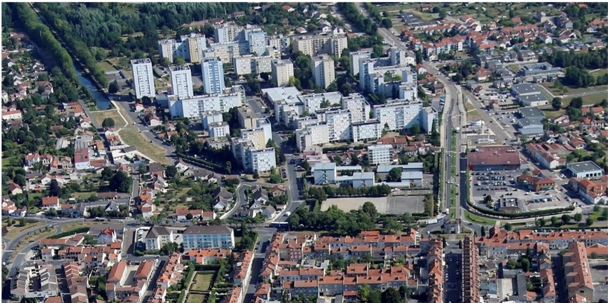
Le quartier du Hamois avant les premières démolitions

Depuis cette date, l'ensemble des partenaires locaux (Communauté de communes Vitry, Champagne et Der, Ville de Vitry-Le-François, Direction départementale des territoires et Le Foyer Rémois) collaborent étroitement pour proposer des grandes orientations urbaines pour le quartier et différents scénarii d'interventions.