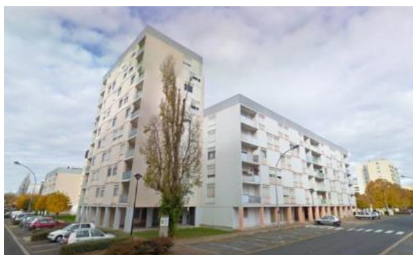
Les Perroquet (à gauche) et Les Goëlands (à droite)

Les immeubles concernés par le présent dossier participent donc à la quatrième phase de démolition. Cette étape correspond à la démolition de 151 logements répartis dans onze bâtiments.