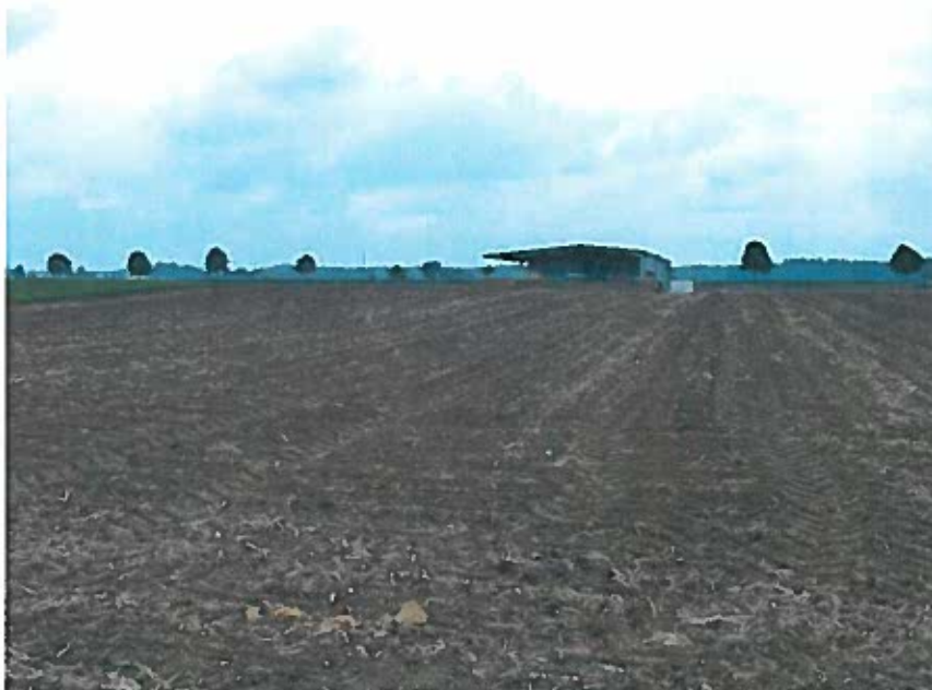
Photo du chemin d'accès existant à l'Est de la parcelle du projet.

Photo de la parcelle prospectée (27/04/2017).