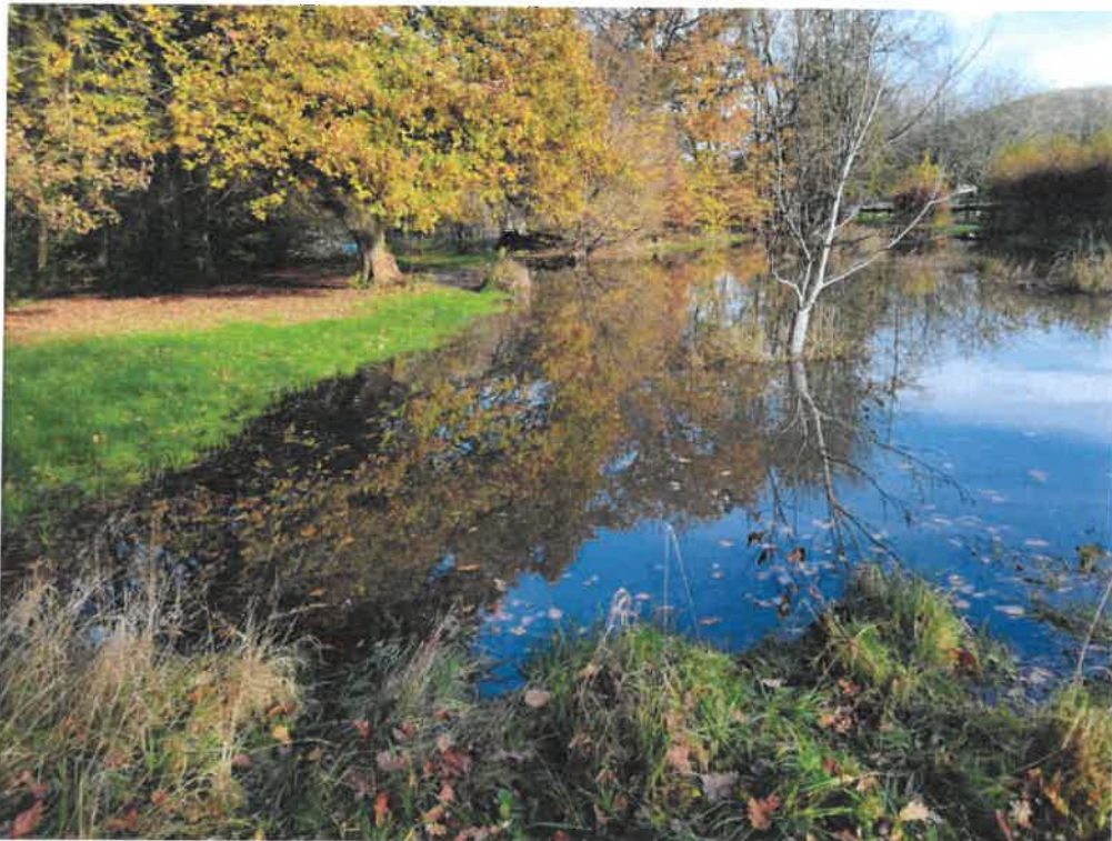
Parcelle de M. Visé sous laquelle passent des drains.