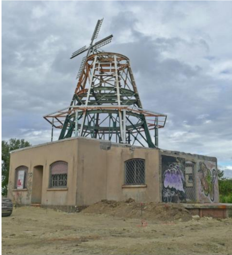
Vue Extérieure du bâtiment