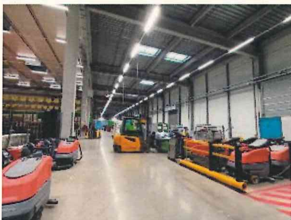
Cellule 8 « recyclage »