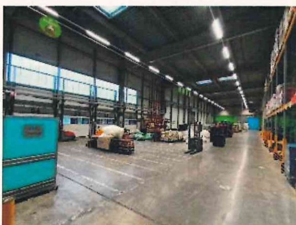
Cellule 8 « recyclage »