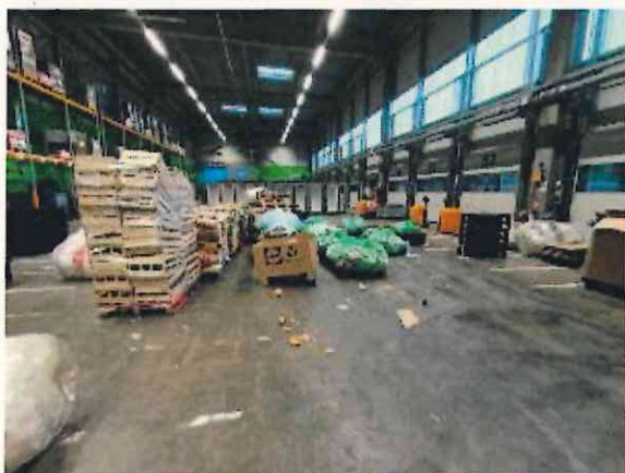
Cellule 8 « recyclage » traitement déchets