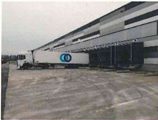
Mise à quai de poids lourds vue extérieure