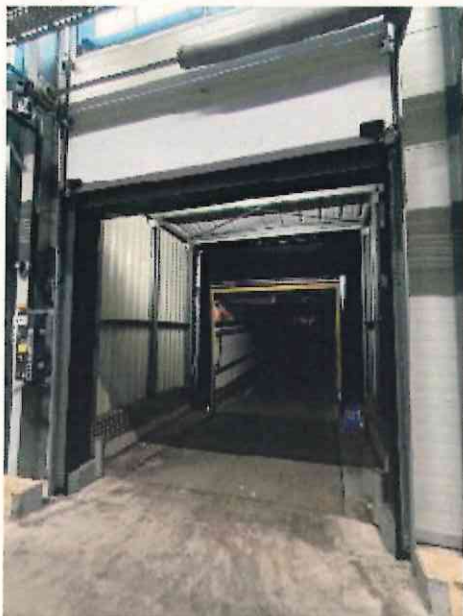
sas du niveleur de quai vue intérieure