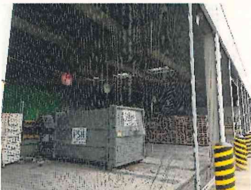
Filet quai benne vue extérieure