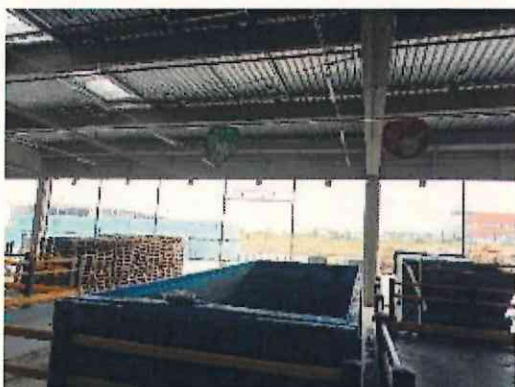
Filet quai bennes vue intérieure