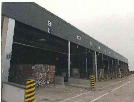
Quai bennes vue extérieure