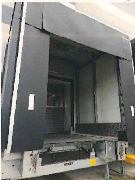
sas du niveleur de quai vue extérieure