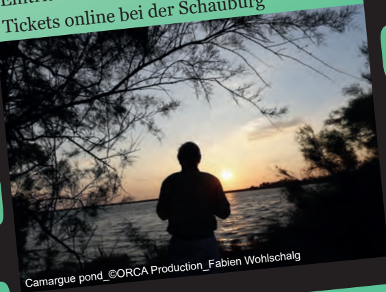
Camargue pond

Dienstag, 31.01.2023, 18:30 Uhr Filmtheater Schauburg, Marienstraße 16, 76137 Karlsruhe Eintritt: 8€, unter 18 Jahren frei Tickets online bei der Schauburg