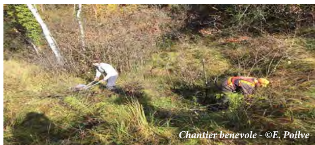
Chantier benevole

Chaque hiver, le Parc Naturel Régional de la montagne de Reims, le Conservatoire d'Espaces Naturels de Champagne Ardenne et les communes de Damery et Venteuil organisent un chantier pour l'entretien des mares du site Natura 2000 des Pâtis de Damery. Le travail, qui consiste à une coupe manuelle du bois présent dans et aux abords des mares mobilise chaque année une dizaine de volontaires.