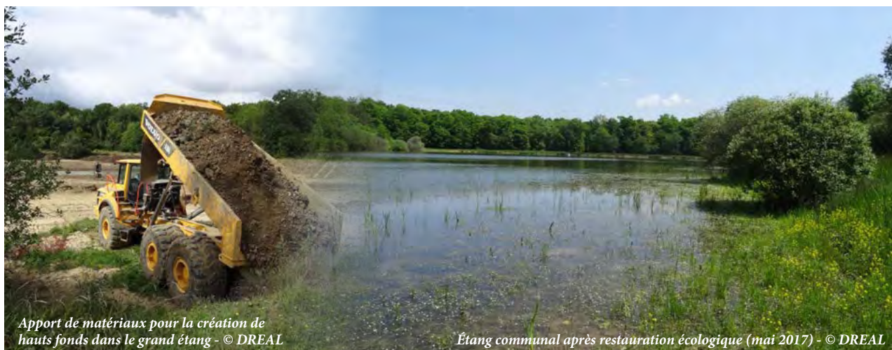
Apport de matériaux pour la création de hauts fonds dans le grand étang

Principaux partenaires : Commune, Parc Naturel Régional de Lorraine, Agence de l'Eau, Onema, Fédération de pêche, MFR de Damvillers, Fondation du patrimoine