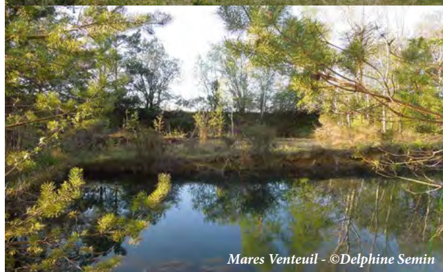
Mares Venteuil