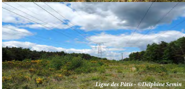
Ligne des Pâtis