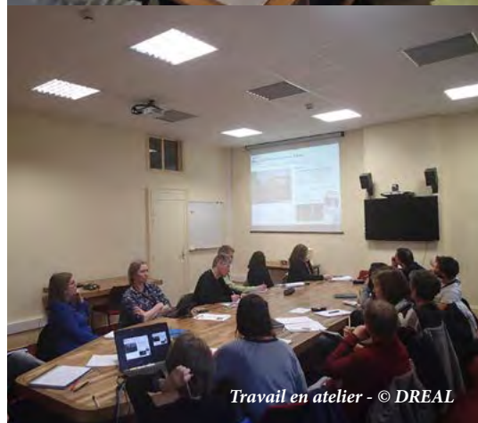
Travail en atelier