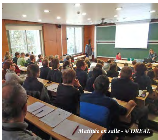
Matinée en salle

http://www.grand-est.developpement-durable.gouv.fr/journee-des-acteurs-grand-est-20-novembre-2017-a17278.html