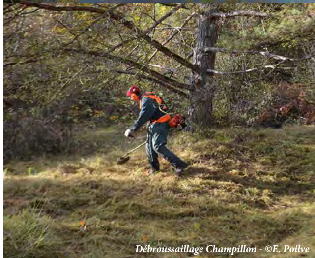
Débroussaillage Champillon

En 2017, deux autres campagnes de chantier bénévoles sur des sites Natura 2000 sont venues compléter le dispositif, l'une dans un but de restauration d'une pelouse, l'autre pour lutter contre une espèce exotique envahissante.