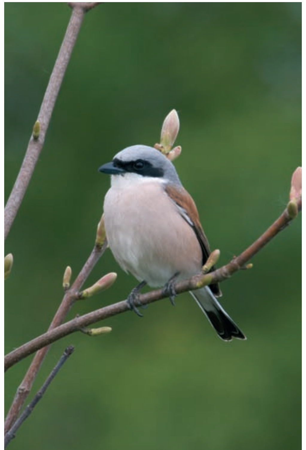
1-2 Pie-grièche écorcheur mâle © HERVÉ MICHEL 3 Pie-grièche écorcheur mâle en vol © GILLES PIERRARD 4 Femelle de Pie-grièche écorcheur © HERVÉ MICHEL