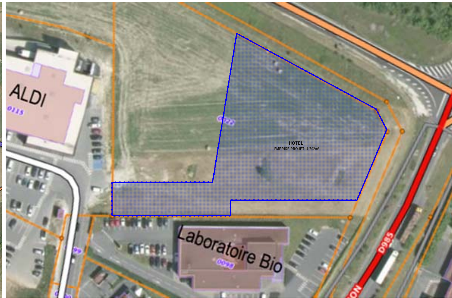
EMPRISE PARCELLAIRE Ech: 1/1000