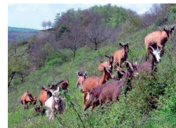
Pâturage caprin sur les rochers de Maurière