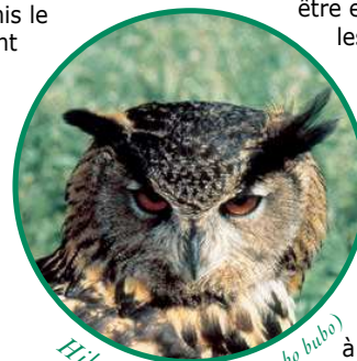
Hibou grand duc (Bubo bubo)

En effet, 454 espèces végétales ont été recensées. Citons par exemple, le cotonéaster sauvage, l'armoise blanche, le pied de chat et l'orchis singe, espèces emblématiques des zones rocheuses et des pelouses sèches du secteur.