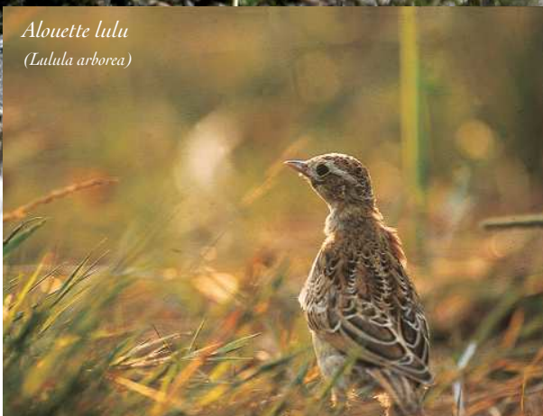
Alouette lulu ( Lulula arborea )