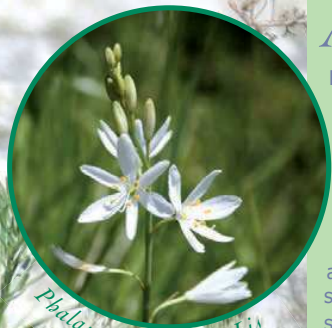
Phalangère à fleur de Lis