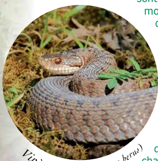
Vipère péliade (Vipera berus)

La variété des milieux naturels offre des habitats de qualité pour plus de 320 espèces animales. De nombreux insectes amateurs de lieux ensoleillés sont présents comme le moiré franconien, l'azuré de l'ajonc, le tétrix calcicole ou le dectique verrucivore. La vipère péliade et la coronelle lisse affectionnent les zones rocheuses. La réserve abrite aussi des oiseaux rares tels l'engoulevent d'Europe, le hibou grand duc, l'alouette lulu. Les chauves-souris, ont trouvé refuge dans les cavités naturelles ou artificielles, notamment le grand rhinolophe et le grand murin.