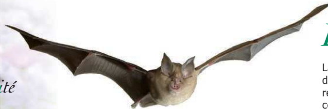
Grand Rhinolophe (Rhinolophus ferrumequinum)

La Pointe de Givet est connue depuis le XIX ème siècle pour son intérêt botanique et géologique. Au milieu des années 1980, elle est répertoriée à l'inventaire des Zones Naturelles d'Intérêt Ecologique Faunistique et Floristique (ZNIEFF). En 1990, une association locale demande le classement en réserve naturelle des zones les plus intéressantes. La réserve est enfin créée en 1999 et confiée en gestion à l'Office National des Forêts et au Conservatoire du patrimoine naturel de Champagne-Ardenne.