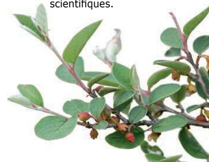
Cotonéaster sauvage (Cotoneaster integerrimus)

Cette réserve nationale est gérée par l'Office National des Forêts et le Conservatoire du patrimoine naturel de Champagne-Ardenne. Pour être efficacement gérés, les milieux naturels doivent faire l'objet d'une connaissance approfondie. Les co-gestionnaires sont donc chargés de concevoir et appliquer un plan de gestion. Ce document définit les travaux de gestion à mettre en œuvre (débroussaillage des pelouses, remise en pâturage...) ainsi que les suivis et évaluations scientifiques.