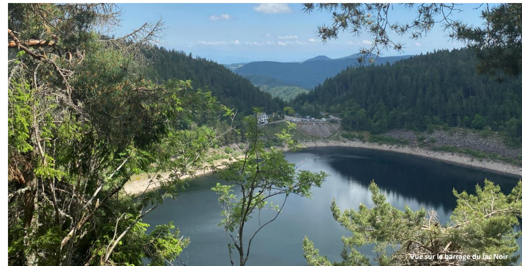
Vue sur le barrage du lac Noir

COMMUNE D'ORBÉY CONSULTATION DES USAGERS DE L'EAU Du 28/06/2022 au 16/09/2022